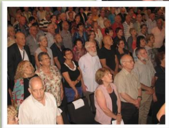
ערב עיון בנושא כ"ג / כ"ד יורדי הסירה