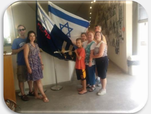
משפחה נרגשת בביקור

מוזיאון מומלץ, חווית חושית המעבירה את התקופה, הארועים והדמויות באופן חדשני יוצא מהכלל, מתאים לילדי בית ספר וכמובן מבוגרים, בספריה של המוזיאון ניתן למצוא חומר ארכיוני מקורי נדיר.