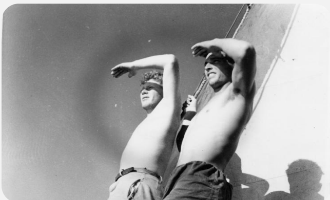
בית הפלמ"ח - עם הפנים קדימה