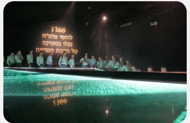
קציני פוי"ם בתצוגת "מסע פלמי"ח"